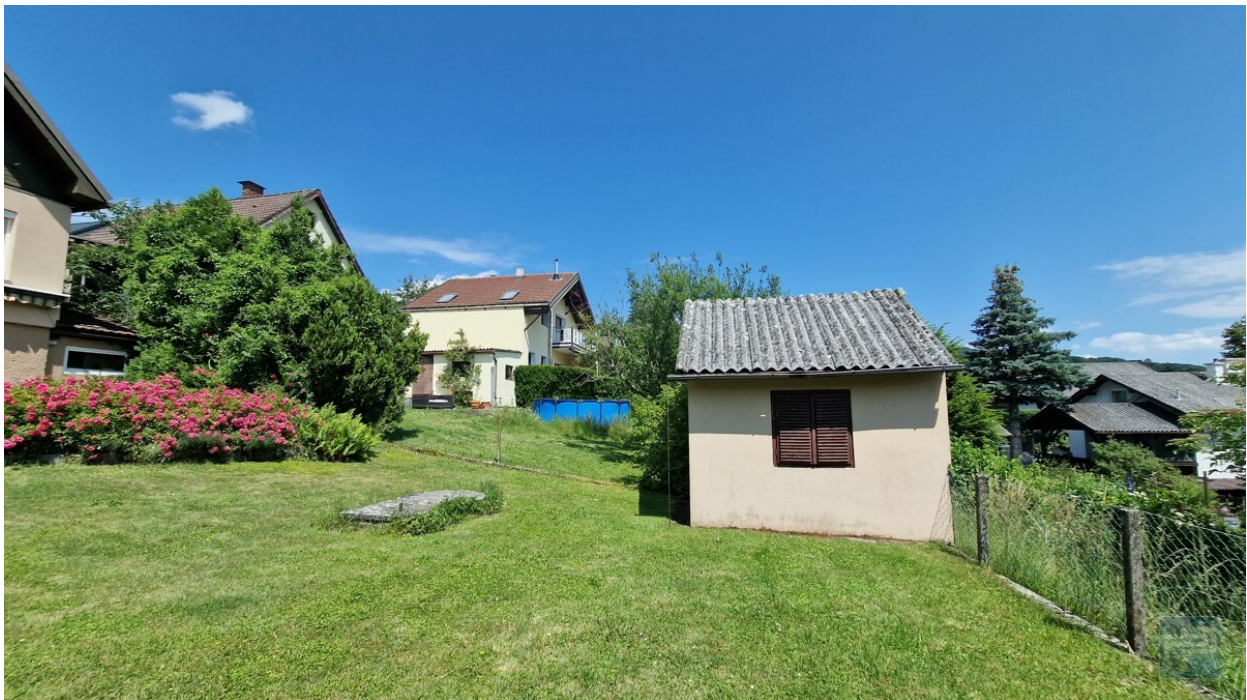
Gerätehaus im unteren Gartenbereich