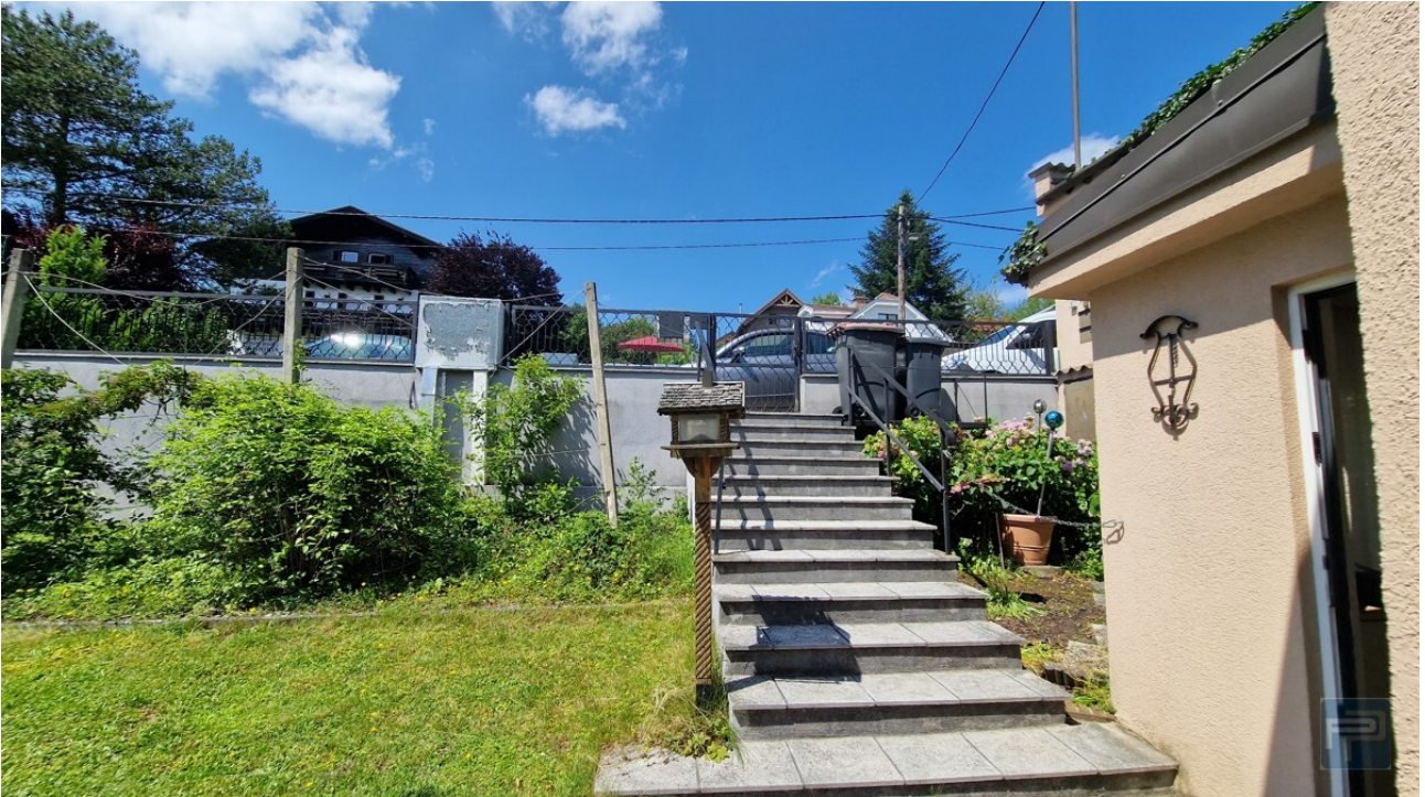
Stiegenaufgang zur Strasse