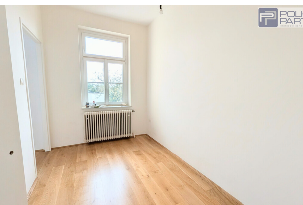
Essbereich vor Küche